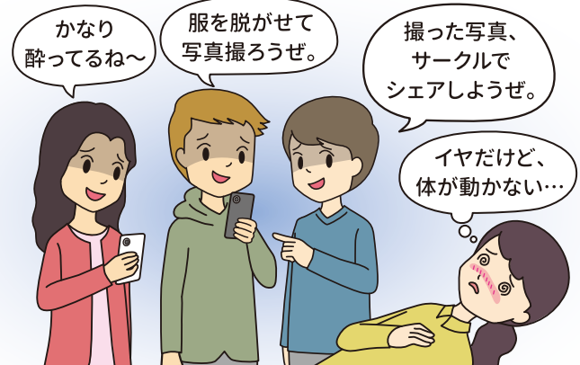
裸の写真を撮られてしまった・・・